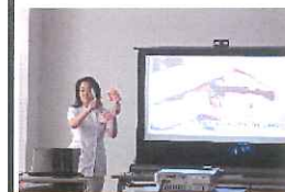
介護予防教室口腔指導(上牧町)