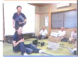
座布団筋トレ(明日香村)