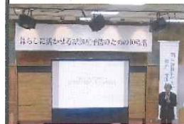
認知症予防講演(香芝市)