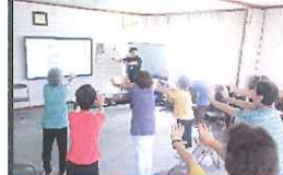
誤嚥にならん！体操(河合町)