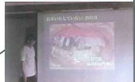
歯科医師講演(宇陀市)